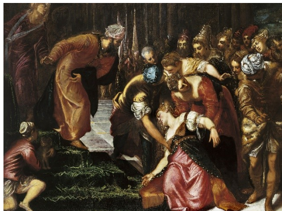
טינטורטו, אסתר לפני אחשוורוש, 1547-1548, מצודת וינודור, אנגליה

ומרמברנדט, נעבור לראות אסתר אחרת לגמרי, אסתר של תיאודור שאסריו. הסיפור כאן, הוא רק תירוץ לתיאורה של אישה: צעירה, נשית, חושנית, יפה ובלונדינית – ממש כמו הנשים בפרס, נכון? וקשה שלא לראות שהיא ארוכה, ארוכה ואין פרופורציות בין הראש הקטן שלה, לבין שאר חלקי הגוף. נראה שהיא בטוחה בעצמה, היא יודעת שהיא תצליח במשימה ובדרך לשם, היא לא מאבדת מן הנשיות שלה.