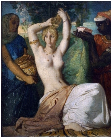
תיאודור שאסריו, אסתר מתייפה לקראת פגישתה עם אחשוורוש, 1841, לובר, פאריז

השקועה בהרהורים, מייצגת את מה: שקדוש, טוב וקשור לאלוהי; טוהר וקדושה כפי שרמברנדט מבין מרוח הטקסט, אותו הוא למד והכיר. משמעות זו מתעצמת, דרך הניגודיות הקיימת בציור, בין העלטה הגדולה והאור שיוצא ממנה . הרב קוק אמר, בין היתר: (אתם מדמיינים רב, בישראל של היום, אומר את זה?) "התמונות האהובות עליי ביותר היו של רמברנדט. לדעתי, רמברנדט היה צדיק...מדי פעם ישנם אנשים דגולים שהשם מברך אותם בראיית האור הגנוז...אחד מהם היה רמברנדט, והאור שבתמונותיו הוא האור שברא אלוהים בימי בראשית."