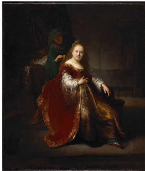
רמברנדט, אסתר מתייפה לקראת פגישתה עם אחשוורוש, 1633, קנדה

אסתר, כמו סוכנת סמויה, הייתה עסוקה בעיקר בלהציל את העם היהודי. היא ממש הקריבה את עצמה והתחתנה עם מלך פרסי; אסתר היא אחת מן הגיבורות של העם היהודי. אבל, את מרבית האמנים הנוצריים, לא משנה מאיזה מדינה, עיר או אזור, לא כל כך עניין נושא הצלת העם היהודי, זה העסיק אותם ואת הפטרונים, הרבה, הרבה פחות, אם בכלל. נראה כי ההתייחסות היא בעיקר ליופייה של המלכה, כמו שכתוב "נתתי אֶסְתֵּר נְשֵׂאת חַן בְּעֵינַי כָּל רֵאִיהָ."